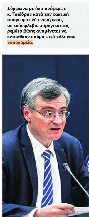
Σύμφωνα με όσα ανέφερε ο κ. Τσιόδρας κατά την τακτική απογευματινή ενημέρωση, σε ενδοφλέβια χορήγηση της ρεμδεσιβίρης αναμένεται να ενταχθούν ακόμη επτά ελληνικά νοσοκομεία.

ΒΑΣΙΜΕΣ ΕΛΠΙΔΕΣ ΣΤΟΝ ΑΓΩΝΑ ΚΑΤΑ ΤΗΣ ΠΑΝΔΗΜΙΑΣ ΑΠΟ ΤΗ ΧΡΗΣΗ ΤΗΣ ΟΥΣΙΑΣ ΡΕΜΔΕΣΙΒΙΡΗ