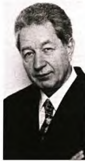
Ο Αυστριακός συγγραφέας, θεατρολόγος, πανεπιστημιακός (ομότιμος καθηγητής του Τμήματος Θεατρικών Σπουδών ΕΚΠΑ) γράφει αποκλειστικά στην «Εφ.Συν.» για την εποχή του κορονοϊού

Κι έτσι είμαστε εκτεθειμένοι στο άγνωστο, το αβέβαιο, το απρόβλεπτο, ανά πάσα στιγμή κι όπου και να βρισκόμαστε. Απέναντι στους άγνωστους κινδύνους οι ασφάλειες είναι επισφαλείς και επινοούμενες, οι βεβαιότητες ευάλωτες και φανταστικές. Κι έτσι ο ανασφαλής άνθρωπος καταφεύγει σε μαγείες, θρησκείες, προφητείες, μαντική, σε ωροσκοπία και μάντιο πάσης φύσεως.