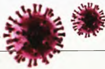
ΕΥΑΓΓΕΛΙΣΜΟΣ ΠΑΛΑΙΩΣ ΓΑ/ΠΑΡΟΝΗΣ ΣΠΥΡΙΔΩΝ

Στα νοσοκομεία Αττικής, Ευαγγελισμός, Σωτηρία και ΑΧΕΠΑ χορηγείται ήδη ενδοφλέβιο φάρμακο με θετικά αποτελέσματα, ενώ αναμένεται να ενταχθούν ακόμα επτά νοσοκομεία στην ερευνητική «μάχη» κατά του κορωνοϊού